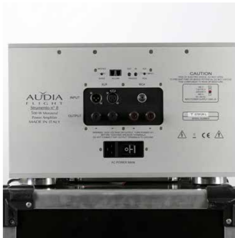
Illegitimiert für: Seveking Sound GmbH & Co. KG, Rantage 20, 28315 Bremen

gestalterisch, sondern insbesondere auch klanglich. Ihre Performance hat schon im kalten Zustand so rein gar nichts Technisches an sich, obwohl das Trumm bis zur Oberkante voll mit Technik steckt. Der Zuhörer muss niemals überlegen, ob das jetzt alles so seine Richtigkeit hat. Er wird stattdessen ganzkörperhaft mitgerissen und unmittelbar mitten hinein ins große Vergnügen geführt. Die Monos klingen dabei picobello sauber, entwickeln keinerlei sezierereische Tendenzen, bleiben immer – und ich meine: immer – extrem stilsicher und profund im Auftritt. Der Doppel-Achter von Audia Flight hat die ihm anvertrauten Schallwandler sprichwörtlich voll im Griff.